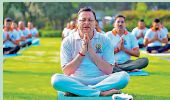
అంతర్జాతీయ యోగా దినోత్సవ సన్మాహాల్లో భాగంగా డెప్రూడూనోల్ గురువారం యోగా సాధన చేస్తున్న ఉత్తరాఖండ్ సీఎం పుష్యసీనిగ్ డామె